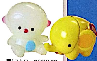
■1ストローク6部分4色 玩具印刷例

スーパーフリーポイント印刷機で 1ストロークで8部分の 曲面やへこみ部分印刷 が可能になった